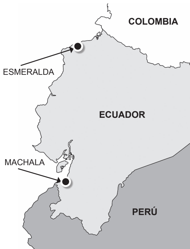
Figura 1. Ubicación de las ciudades de Esmeralda (frontera Ecuador-Colombia) y Machala (frontera Ecuador-Perú)

Se realizó la evaluación genética empleando muestras hemáticas contenidas en papel filtro parasitadas con P. falciparum , recolectadas para el estudio de "Evaluación de eficacia in vivo para evaluación de resistencia molecular a sulfadoxina-pirimetamina" realizado el año 2002 en Ecuador como parte de la Red Amazónica de Vigilancia de la Resistencia a los Antimaláricos (12) . El estudio se desarrolló en las provincias de Machala y Esmeralda, poblaciones endémicas para malaria; Esmeralda esta ubicada hacia la frontera con Colombia y Machala en la provincia del Oro que colinda con Perú, ambas pertenecen a la zona pacífica de Ecuador (Figura 1). (Esmeraldas, latitud=79°39'14"W, longitud= 79°58'00"W, provincia Esmeraldas; y Machala, latitud= 03°16'00S, longitud=79°58'00"W provincia El Oro).