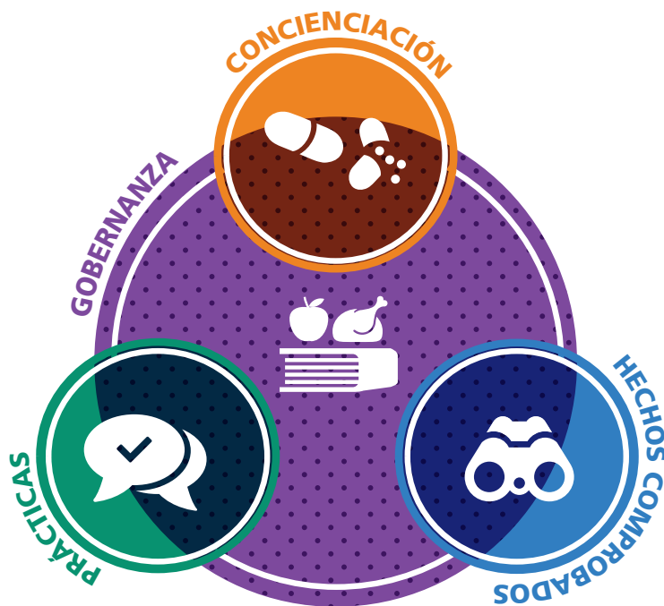
Figura 1. Las cuatro esferas de trabajo prioritarias del Plan de Acción de la FAO sobre la RAM

Las cuatro esferas también enmarcan el apoyo de la FAO para la aplicación del Plan de Acción Mundial sobre la RAM. 10 La figura 2 resume la forma en que las esferas de trabajo prioritarias de la FAO sustentarán los objetivos del Plan de Acción Mundial. La alineación y coordinación de las diversas actividades será facilitada por la colaboración tripartita fortalecida entre la FAO, la OIE y la OMS.